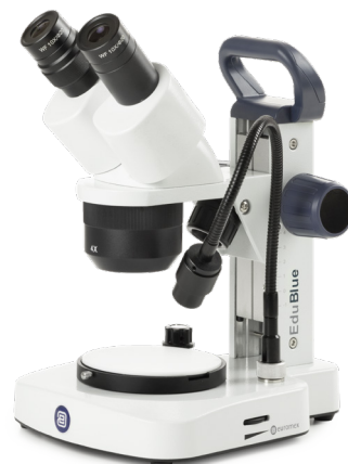
● Zahnstangenstativ ED.1505-S