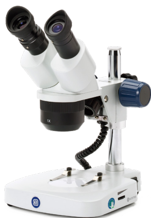
● Säulenstativ ED.1302-P