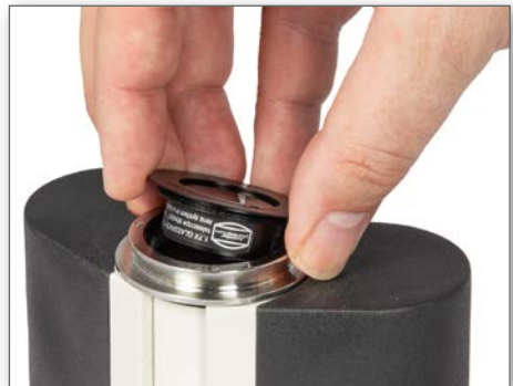
Die beiden 1,25x- und 1,7x-Glaswegkorrektoren werden direkt in den Binokular-Ansatz eingeschraubt.