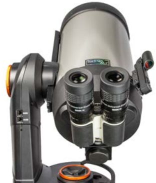
Das MaxBright® II Bino mit dem Flip-Mirror II Zenitspiegel und zwei Hyperion® Universal Zoom Mark IV Okularen an einem Schmidt-Cassegrain.

Im Gegensatz zu den üblichen Zoom-Konstruktionen sind unsere Hyperion® Universal Zoom Mark IV Okulare so gerechnet, dass das Okular bei der höchsten Vergrößerung auch das größte Gesichtsfeld und die beste Schärfeleistung aufweist. Einfache Zoom-Okulare sind genau andersherum konstruiert. Aus diesem Grunde sind gerade die Hyperion®-Zoom-Okulare besonders für die binokulare Verwendung geeignet. Vor allem die ClickStop Rast-Funktion ermöglicht es, kontrolliert die Vergrößerung zu ändern.