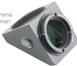
T-2 / 90° Zenitprisma mit 32 mm Prismen #2456095