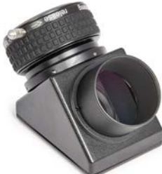
Baader 2" BBHS® Zenitprisma mit 2" ClickLock®-Klemme # 2456117