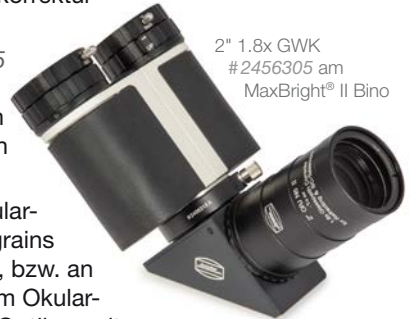
2" 1.8x GWK #2456305 am MaxBright® II Bino

ACHTUNG: Da dieser Glaswegkorrektor® tief im Okularauszug versenkt wird, kann er nur an Schmidt-Cassegrains mit ausreichend großem Blendrohr verwendet werden, bzw. an Geräten ohne zusätzliche Bildfeldebnungslinsen o.ä. im Okularstutzen. An Petzval, EdgeHD oder einigen Maksutow-Optiken mit Korrektor nahe des Okularstutzens kann er daher nicht verwendet werden.