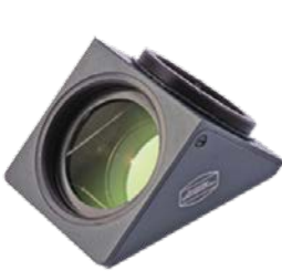
T-2 / 90° Zenitprisma mit BBHS® Beschichtung #2456095