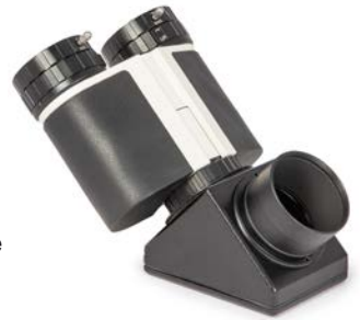
Binokular an 2" BBHS® Zenitspiegel # 2456115

In der folgenden Tabelle ist die Baulänge ohne ClickLock®-Klemme angegeben.