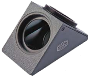
T-2 / 90° Maxbright Zenitspiegel #2456100