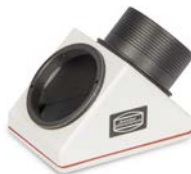
Zenitspiegel mit freiliegendem SC-Gewinde