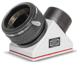
Baader 2" ClickLock® Zenitspiegel mit 2" ClickLock®-Klemme # 2956100

Informationen zum Entfernen der 2"-Steckhülse finden Sie ab Seite 16.