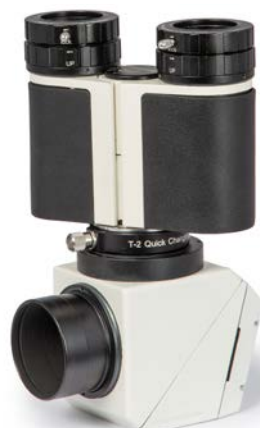
Großfeld-Bino und Glaswegkorrektor® auf dem Herschelprisma

Achtung: Wenn Sie einen Glaswegkorrektor® in den SC/T-2-Adapter #1508035 legen, stößt dieser an den Filter an, wenn der Filter ganz eingeschraubt ist. Das gilt immer für den 2,6x GWK, aber auch für die kürzeren Glaswegkorrektoren, wenn das Zeiss-Mikrobajonett nicht genutzt wird. Bei Verwendung eines GWK im SC/T-2-Adapter dürfen Sie die 2"-Filter nicht ganz in den Adapter einschrauben.