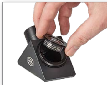
Einbau der Glaswegkorrektoren 1,25x, 1,7x und 2,6x in die Baader T-2 Prismen und Spiegel.