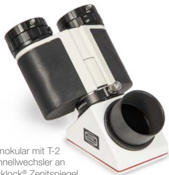
Binokular mit T-2 Schnellwechsler an 2"-ClickLock® Zenitspiegel