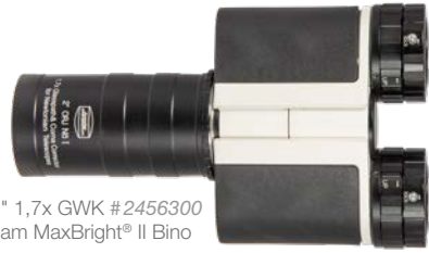
2" 1,7x GWK #2456300 am MaxBright® II Bino

Der 2" Newton-Glaswegkorrektor® #2456300 bringt etwa 80 mm Fokusgewinn und ist an vielen Newtons die einzige Möglichkeit, in den Fokus zu kommen, ohne den Hauptspiegel zu versetzen oder den Tubus zu kürzen.