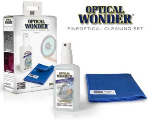
Baader Optical Wonder™ Reinigungsflüssigkeit und Microfasertuch sind auch als Set erhältlich. #2905009

WICHTIGE WARNUNG! Versuchen Sie NICHT, den Binokularansatz auseinanderzunehmen und versuchen Sie NICHT, sein Inneres zu reinigen!