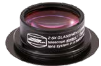
T-2 Glaswegkorrektor® Faktor 2,6 #2456317