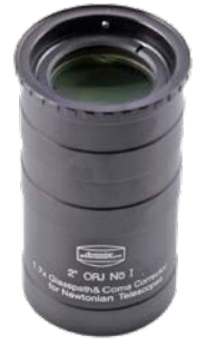
#2456300 1,7x GWK und Koma- korrektor für Newtons