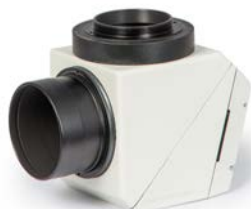
Das Herschelprisma ohne ClickLock®, aber mit dem T-2-Adapter #1508035.

Die Glaswegkorrektoren 1,25x und 1,7x werden ohne den schwarzen Spacer Ring in die Ringschwalbe des MaxBright® II geschraubt. Der 2,6x Glaswegkorrektor® wird mit dem schwarzen Spacerring in den SC/T-2-Adapter #1508035 gelegt. Er wird dann von der Ringschwalbe des Binokulars geklemmt.