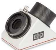
Zenitspiegel mit optionalem T-2 Schnellwechsler