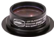
T-2 Glaswegkorrektor® Faktor 1,25 #2456314(Z)

GWK's zum Einsatz in Zenitprismen bzw. MaxBright® II Gehäuse