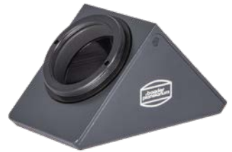
T-2 BBHS® Zenitspiegel #2456103