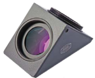
T-2 / 90° Amici-Prisma mit BBHS® Beschichtung #2456130