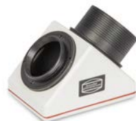
Zenitspiegel mit eingeschraubtem T-2-Adapter

Die 2" ClickLock®-Klemmen unserer 2"-Zenitspiegel und -prismen sowie des Herschelprismas lassen sich entfernen. Dazu müssen Sie entweder die kleinen Schrauben mit einem Inbusschlüssel lösen, wie hier am Beispiel des BBHS®-Zenitspiegels # 2456115 gezeigt, oder die Okularklemme im Falle des Herschelprismas wie in der Anleitung beschrieben abschrauben. Dann wird ein 2"-SC-Gewinde zugänglich, in das der 2"/T-2-Adapter # 1508035 eingeschraubt wird. In diesen Ring wird der Glaswegkorrektor eingesetzt, genau wie in die 1¼"-Steckhülse. Nun kann das MaxBright® II entweder direkt mit der vorinstallierten T-2-Überwurfmutter aufgeschraubt werden, oder Sie schrauben den optionalen TQC-Schnellwechsler # 2456313A an das Gehäuse, um das Zeiss Mikrobajonett zu verwenden.