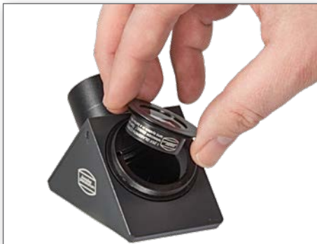
Einbau des 2,6x Glaswegkorrektors in die verschiedenen Baader T-2 Prismen und Spiegel