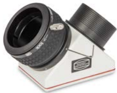
Entfernen der ClickLock® mit einem Sechskantschlüssel