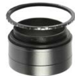
#2408150 2" Steckhülse