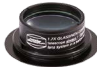
T-2 Glaswegkorrektor® Faktor 1,7 #2456316(Z)