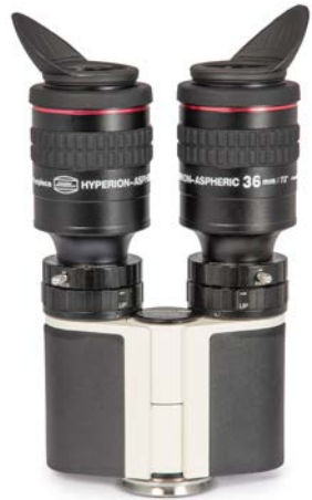
Zwei 36 mm Hyperion® Aspheric am MaxBright® II Binokularansatz

Beide Okulare vermeiden den für längere Brennweiten typischen "Tunnelblick", sodass Sie niedrige Vergrößerung und angenehmes Bildfeld vereinen.