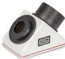
Zenitspiegel mit T-2-Adapter und eingebautem Glaswegkorrektor

Die 2" ClickLock®-Klemmen unserer 2"-Zenitspiegel und -prismen sowie des Herschelprismas lassen sich entfernen. Dazu müssen Sie entweder die kleinen Schrauben mit einem Inbusschlüssel lösen, wie hier am Beispiel des BBHS®-Zenitspiegels # 2456115 gezeigt, oder die Okularklemme im Falle des Herschelprismas wie in der Anleitung beschrieben abschrauben. Dann wird ein 2"-SC-Gewinde zugänglich, in das der 2"/T-2-Adapter # 1508035 eingeschraubt wird. In diesen Ring wird der Glaswegkorrektor eingesetzt, genau wie in die 1¼"-Steckhülse. Nun kann das MaxBright® II entweder direkt mit der vorinstallierten T-2-Überwurfmutter aufgeschraubt werden, oder Sie schrauben den optionalen TQC-Schnellwechsler # 2456313A an das Gehäuse, um das Zeiss Mikrobajonett zu verwenden.