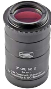
#2456305 1,7x GWK für Refraktoren und Schmidt-Cassegrain

Ein Glaswegkorrektor® (GWK) dient dem Ausgleich des Glaswegs – also dem Weg, den das Licht durch die Prismen im Inneren des Binokularansatzes zurücklegen muss und durch den an schnellen Teleskopen ein Farbfehler entstehen kann. Außerdem verlagern sie den Brennpunkt nach außen. Mehr zur Auswahl des richtigen Glaswegkorrektors finden Sie im Anhang 1 ab Seite 20. Die GWKs mit Z in der Bestellnummer sind für den Einsatz mit dem Zeiss-Mikrobajonett gedacht und unterscheiden sich in der Einbau- richtung von den übrigen GWKs.