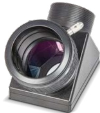
Baader 2" Astro-Amici Prisma mit BBHS® Beschichtung # 2456120