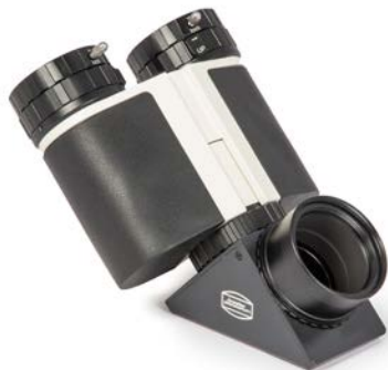
MaxBright® II Bino mit 1¼" Zenitprisma und 2" Steckhülse