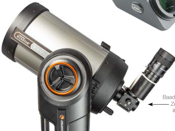
Baader FlipMirror II Zenitspiegel #2456100