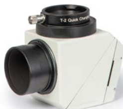
Das Herschelprisma mit dem T-2-Schnellwechsler