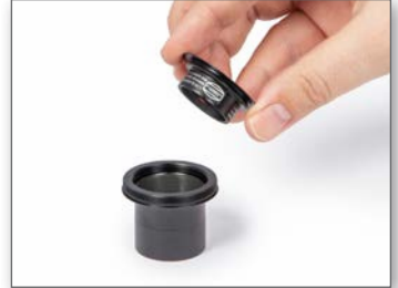
Der Glaswegkorrektor wird einfach in die 1¼" Steckhülse eingeschraubt.

Stülpen Sie den Kunststoffring aus dem Lieferumfang Ihres Glaswegkorrektors über das Gewinde des GWKs. Setzen Sie ihn in die 2"-Steckhülse #2408150 ein.