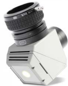
Safety Herschelkeil # 2956500P / # 2956500V