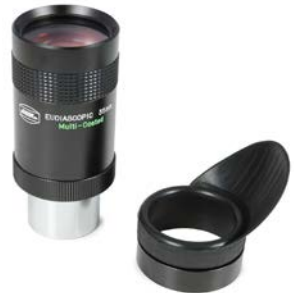
Die Eudiaskopischen Okulare mit 35 mm Brennweite bieten ein sehr großes Bildfeld

Es ist sehr wichtig, identische Okulare zu benutzen, die vom selben Hersteller während des selben Zeitraums produziert wurden. Es ist durchaus möglich, dass Okulare vom selben Typ und Hersteller deutliche optische und mechanische Unterschiede haben, wenn sie aus unterschiedlichen Produktionschargen stammen. Okulare unterschiedlicher optischer Bauart können nicht gemeinsam verwendet werden, weil es in der Regel nicht gelingt, die Bilder jedes Sehkanals richtig zu überlagern.