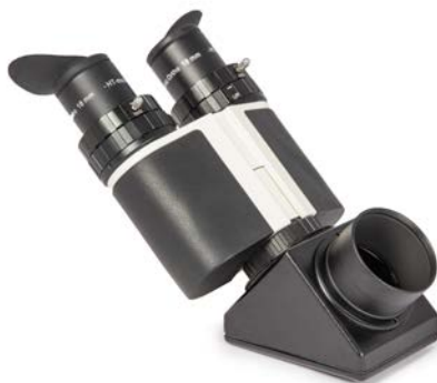
Das Binokular kann über den 2"/T-2-Adapter # 1508035 fest und platzsparend mit unseren 2"-Spiegeln verschraubt werden – hier mit Baader Classic Orthos am 2" BBHS®-Zenit Spiegel # 2456115

Letzlich verwenden viele preisgünstige Zenit Spiegel vergleichsweise zierliche Klemm-Schrauben, welche wiederum nur dafür gedacht sind, ein leichtes Okular zu halten, nicht aber ein schweres Binokular mit zwei Okularen. In astronomischen Kreisen sind Klagen darüber durchaus üblich, dass teure Okulare herunterfallen (und zu Bruch gehen), da die einfachen Klemmungen billiger Zenit Spiegel dem Gewicht nicht gewachsen sind.