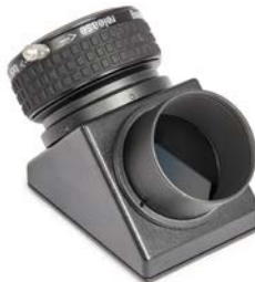
Baader 2" BBHS® Zenitspiegel mit 2" ClickLock®-Klemme # 2456115