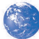
Tierra, Terre, Erde