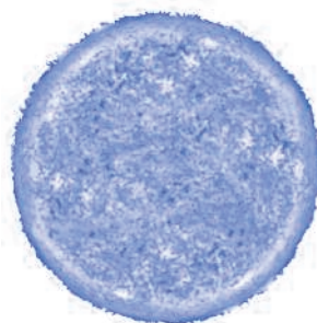
Sol, Soleil, Sonne

Stern Sterne sind riesige, brennende Wasserstoff- und Heliumgaskugeln, die sowohl Licht als auch Hitze