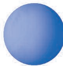
Urano, Uranus, Uranus