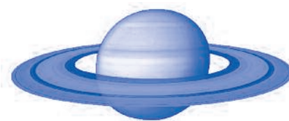
Saturno, Saturne, Saturn