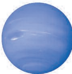
Neptuno, Neptune, Neptun