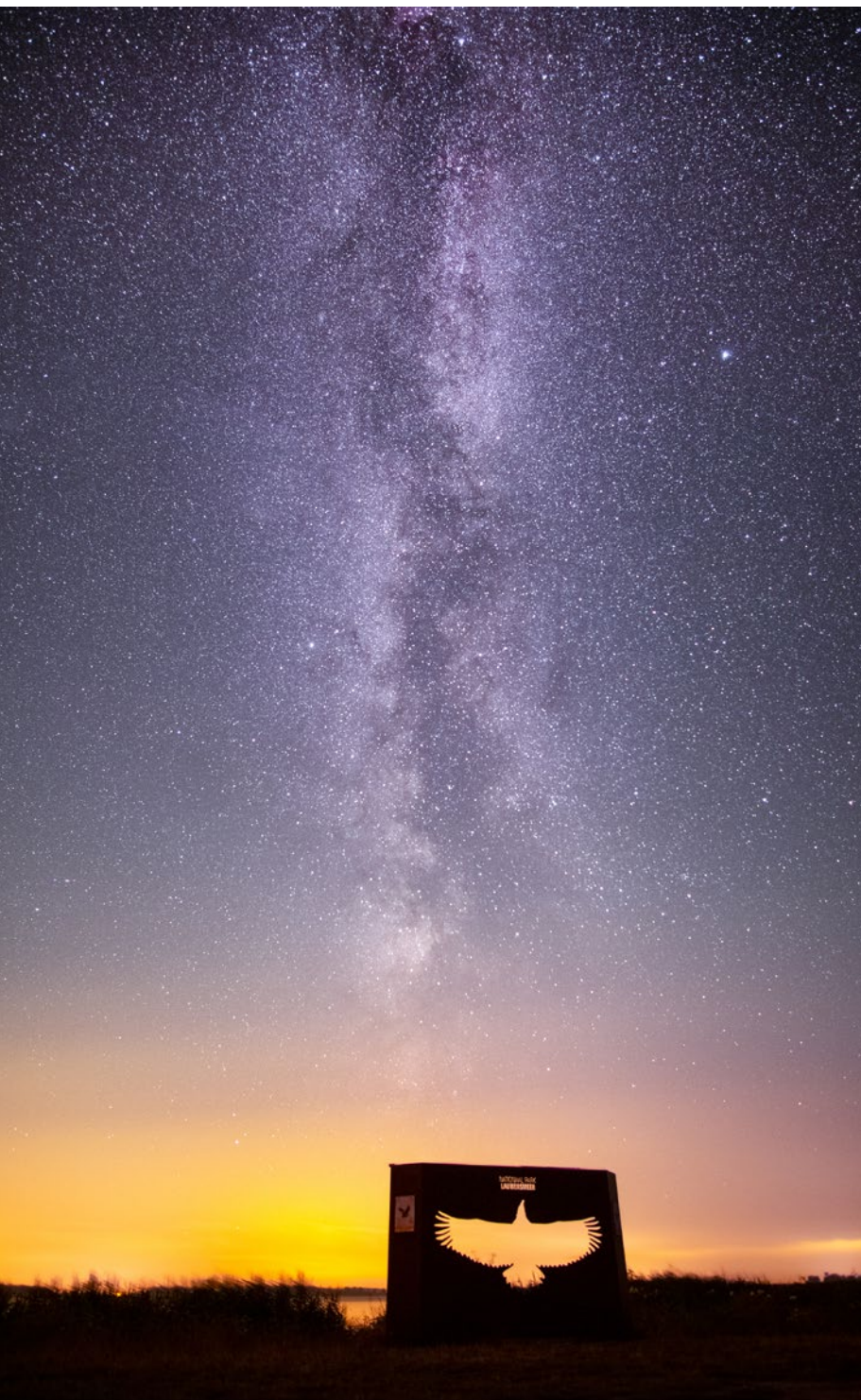
Das Monument des Seeadlers im Nationalpark Lauwersmeer unter dem Sternenhimmel