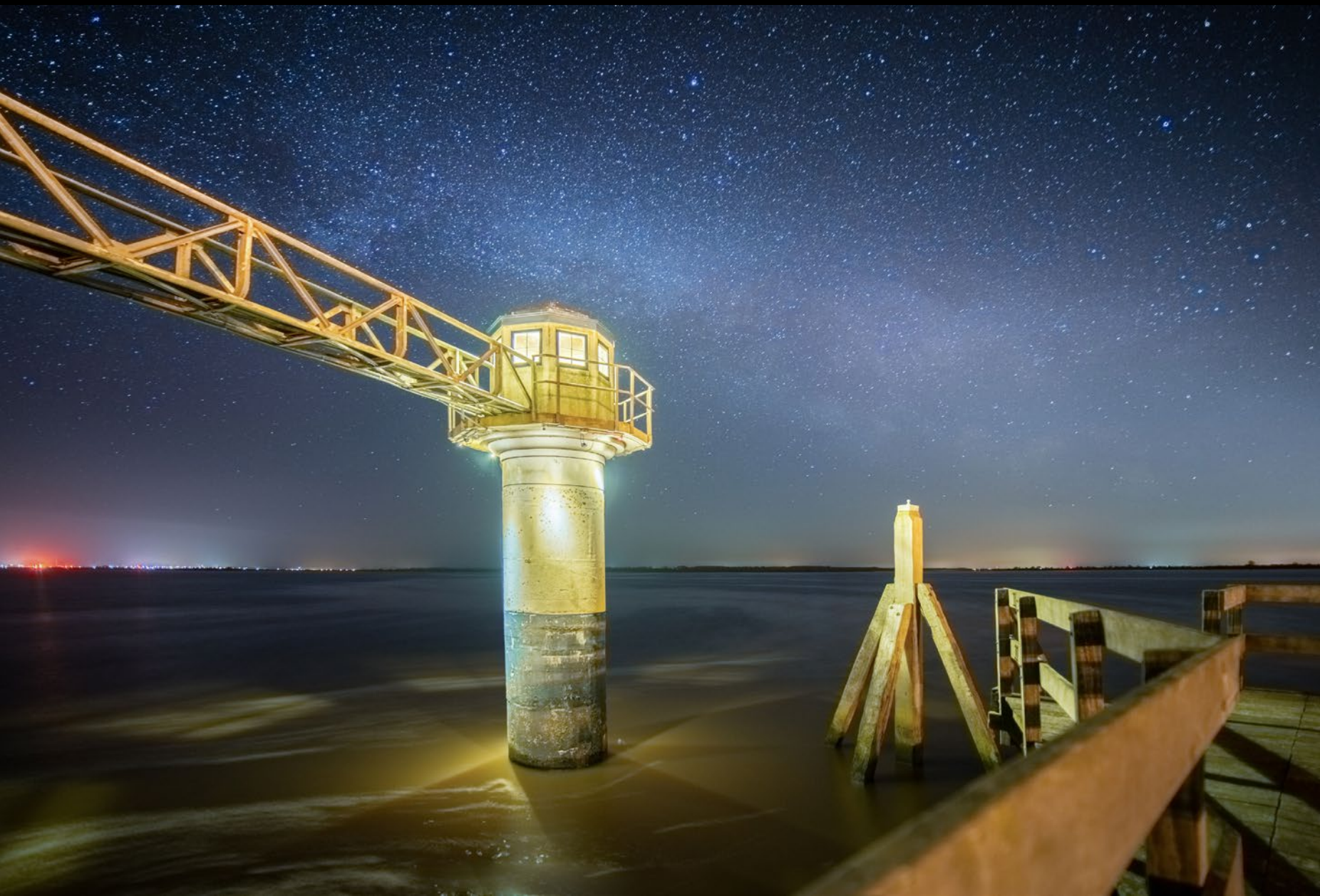
Der kleine Leuchtturm bei Oostmahorn am Lauwersmeer unter dem Bogen der Milchstraße